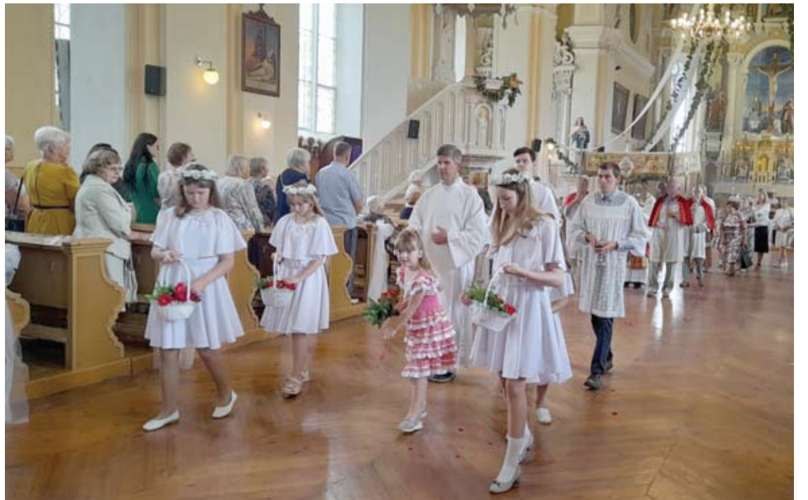
Iškilmingos procesijos Kavarsko šv. Jono Krikštytojo bažnyčioje metu mergaitės barstė žiedlapius.