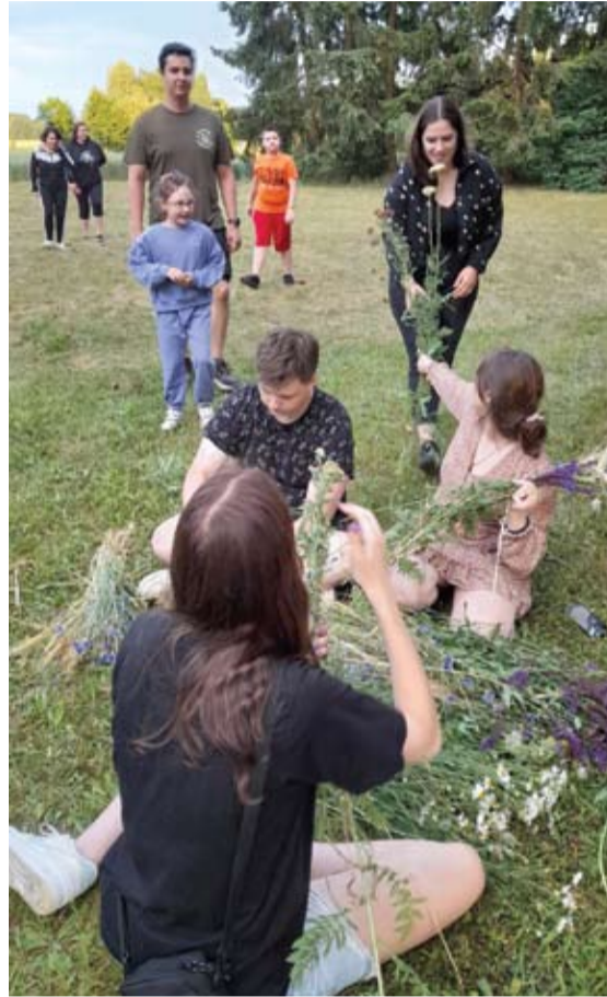
Jaunimas, tradiciškai prisirinkęs žolynėlių, kurie šią sausą vasarą negausiai sužaliavo, pynė Joninių vainikus. Tai neatsiejama Joninių vakaro dalis.

Kavarske tradiciškai iš anksto pasiruošta švęsti Jonines. Dar iki šv. Mišių kelios moterys papuošė bažnyčią pintais vainikais ir juos pakabino nuo pat lubų. Anykščių kultūros centro Kavarsko skyriaus darbuotojai planavo konkrečius renginius, kvietė muzikantus. Nepamiršta pakviesti ir prekybininkų, nes mugė yra neatskiriama Joninių Kavarske dalis. Kaip gi