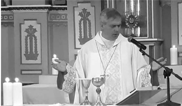
Burbiškio bažnyčioje šv. Mišias aukojo Panevėžio vyskupas ordinaras Linas Vodopjanovas OFM.

Burbiškio parapijos 90-mečio proga prie nuostabiai gražaus Ingos Venslovienės užtiesalu papuošto Burbiškio bažnyčios altoriaus iškilmingas šv. Mišias aukojo Panevėžio vyskupas ordinaras Linas Vodopjanovas OFM, apsilankęs, kaip Ganytojas, po 20 metų.