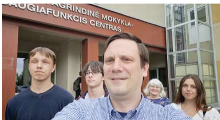
Tomas Tomilinas savo feisbuke džiaugėsi vizitu į Kavarsko pa- grindinę mokyklą-daugiafunkcij centrą.